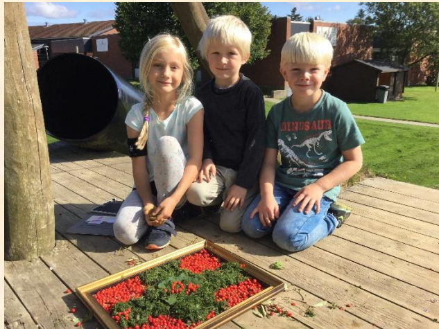
Indskolingens billedkunstprojekt "Naturen i ramme" som skal med på kunstudstillingen