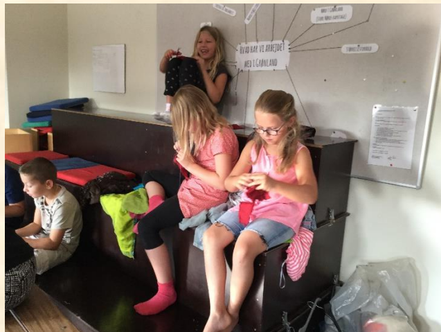
Der arbejdes og samarbejdes med stor koncentration