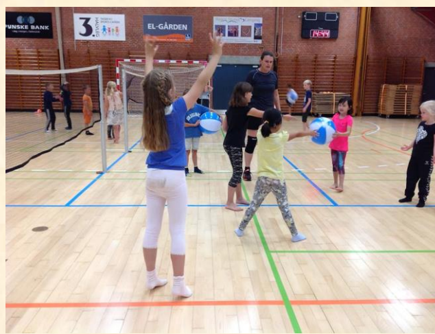
Volleyball i hallen