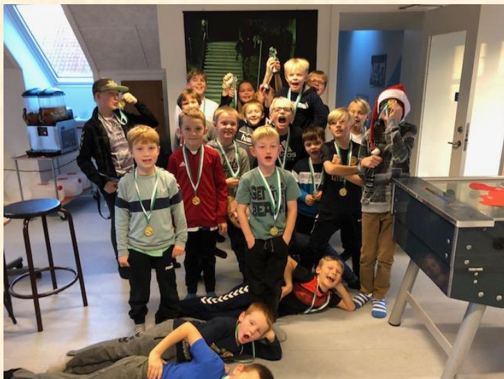
Champions League-deltagere fra alle aldersgrupper ☺