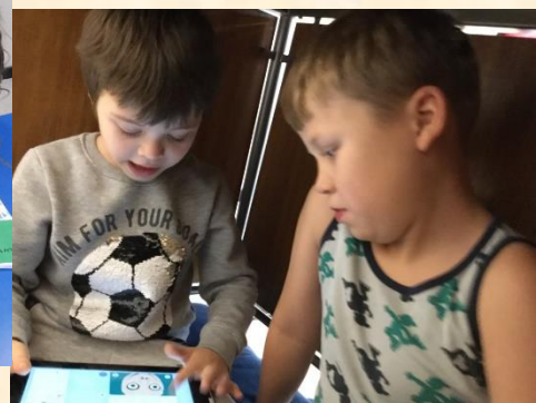
0.kl. og 1.kl. læser sammen ©