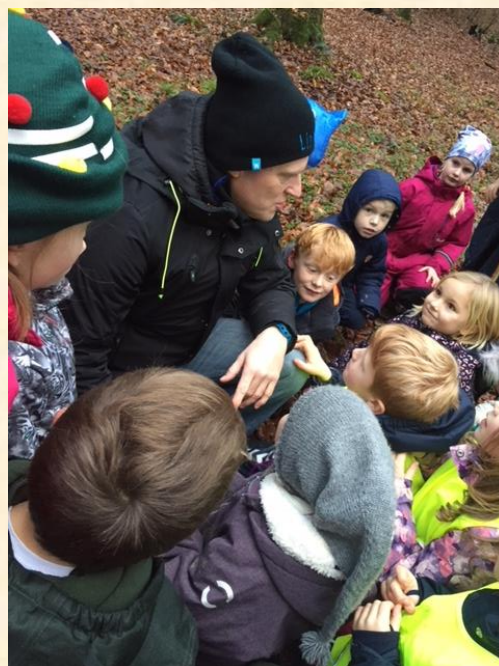
Med ler blev der formet de fineste små væsner, som gemmer sig mellem træerne.