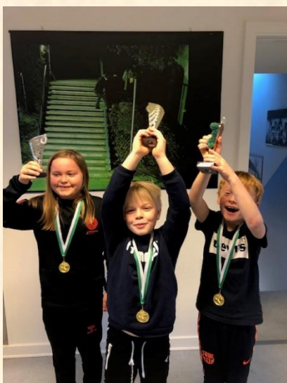
Vinderholdet hæver pokalerne

Efteråret og vinterens første måned har budt på mange aktiviteter i Fritidshuset. Mandagens bålmad er blevet skiftet ud med muligheden for at gå i sløjde. Pigeklubben hygger sig fortsat om tirsdagen, og så er hallen blevet flittigt brugt til bevægelse i de regnfulde måneder. Om tirsdagen har børnene udkæmpet Nerf-krige og torsdagene har stået i fodboldens tegn med Fritidshusets helt egen udgave af Champions League. Der har været afholdt to overnatninger, nemlig Halloween-overnatning for 4.-5.kl og juleovernatning, hvor det var 3.kl og 6.kl., der hyggede sig.