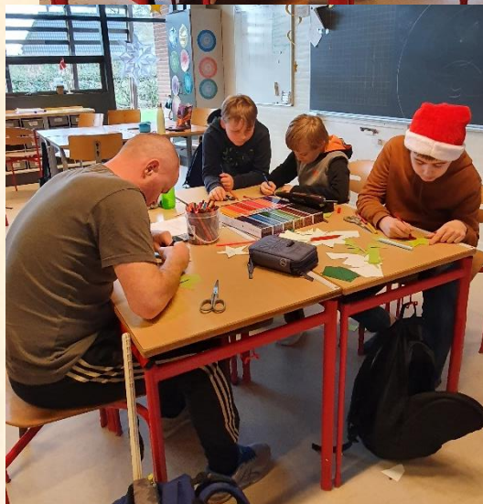
Koncentrationen er stor i 6A....