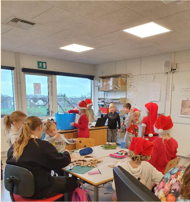
Det vrirler med koncentrerede nissebørn i 2A