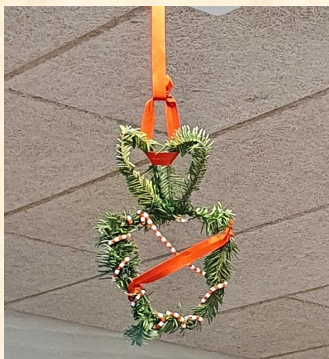
bl.a. fremstillet disse flotte figurer.