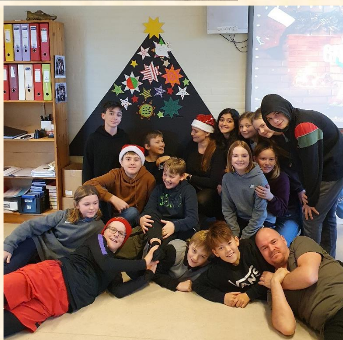
...men så er der én, der udbryder: "Det er jo vores sidste juleklippedag på Gårslev Skole".... GRUPPEFOTO!!!!!!