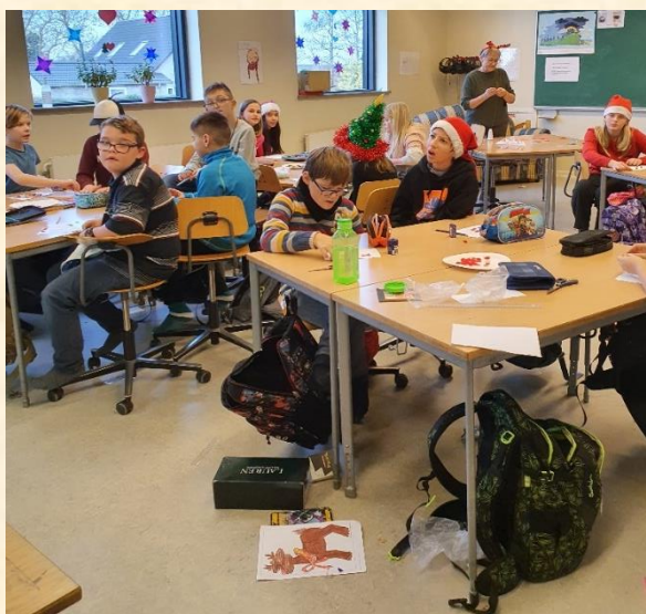
Vinduerne i 4A pyntes smukt.