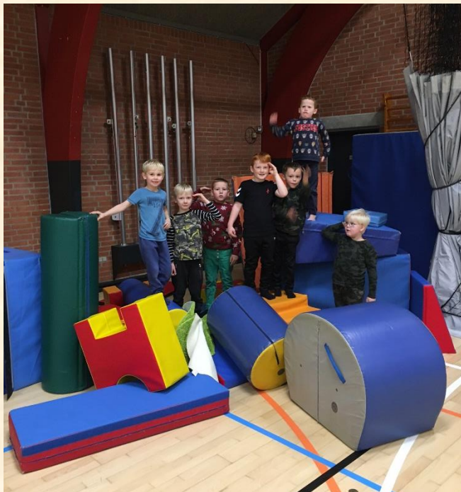
Indskolingen skal have idræt og billedkunst klassevist, så OA smutter en tur i hallen ☺