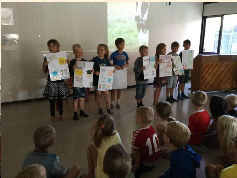
1.klasse viser deres engelske foldebøger