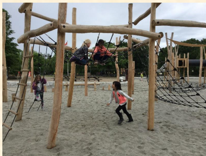
Indskolingen hygger sig i Madsby Legepark