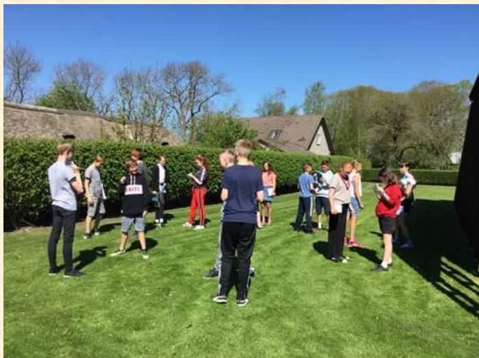
6A inspirerer deler inspiration til brevskrivning

I takt med at dagene er blevet lysere, længere og varmere, bliver også flere og flere af skolens aktiviteter flyttet udendørs. Det er helt naturligt, at idræt rykker ud af hallen, ligesom en del af skoledagens bevægelsesaktiviteter også foregår ude i sollyset. I frikvartererne er det en stor fornøjelse at iagttage, hvordan store og små elever hygger sig med at spille rundbold sammen. Man bliver både stolt og glad, når man ser, hvor gode vores elever er til at tage hensyn til og hjælpe hinanden ☺