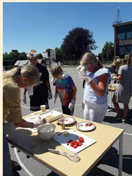
Den store bagedyst på Fælleshåbsskolen

Så er det atter den tid på året, hvor eleverne i 6.klasse har været i gang med diverse brobygningsaktiviteter med Fælleshåbsskolens 6.klasser for at sikre den bedst mulige overgang til de kommende 7.klasser. De nuværende lærere i 6.klasserne har gjort et stort arbejde for at få rystet eleverne på de to skoler sammen, så de forhåbentlig alle glæder sig til en ny og spændende start efter sommerferien.