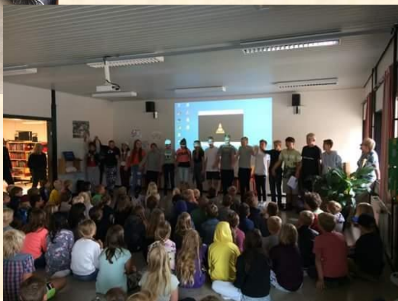
6A synger en engelsk sang om venskab