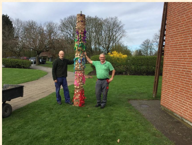
Så er totempælen fra Trivselsfestivalen på plads ☺