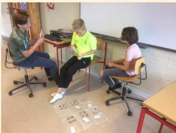
5A repeterer matematik ved hjælp af spil