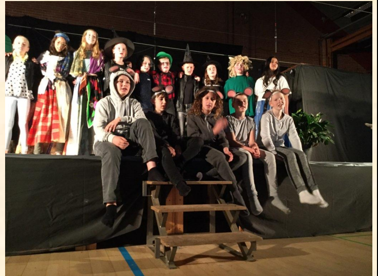
Tak til 5A for et flot skuespil ☺