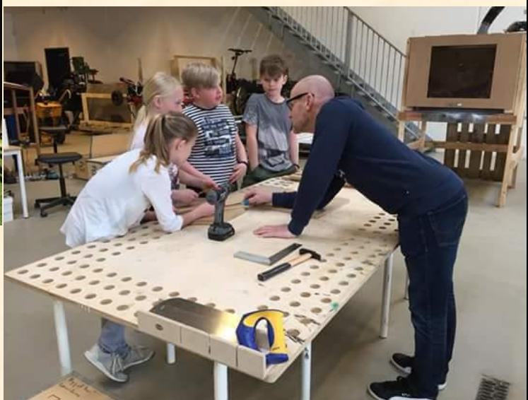
3A er med i projekt "Byg et hus"