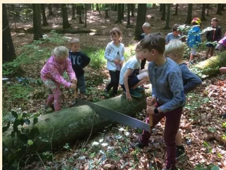
1A lærer om skov, træer og skovbrug