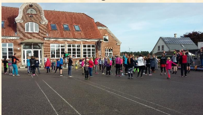
Opvarmning til skolernes motionsdag.