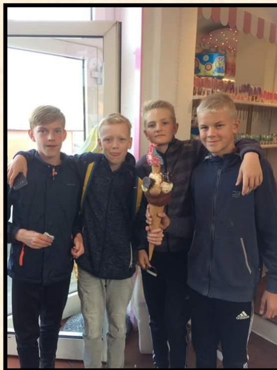
De har store is i Gudhjem