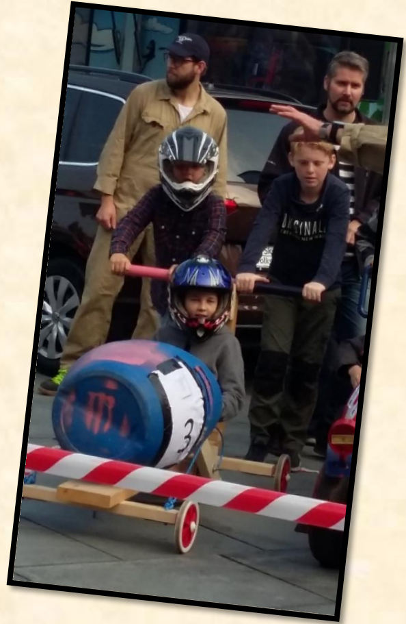
Der blev løbet hurtigt.