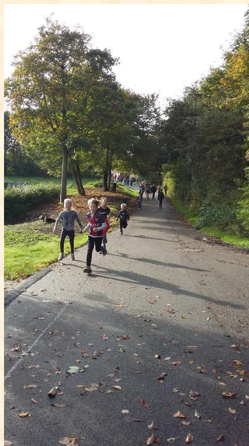
Så er første omgang klaret.