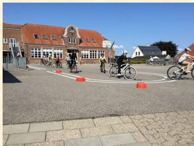
4A træner i skolegården