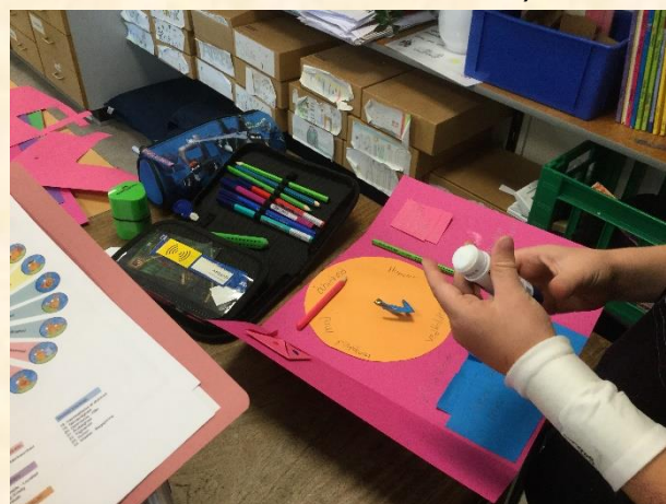
Styrker i 3A