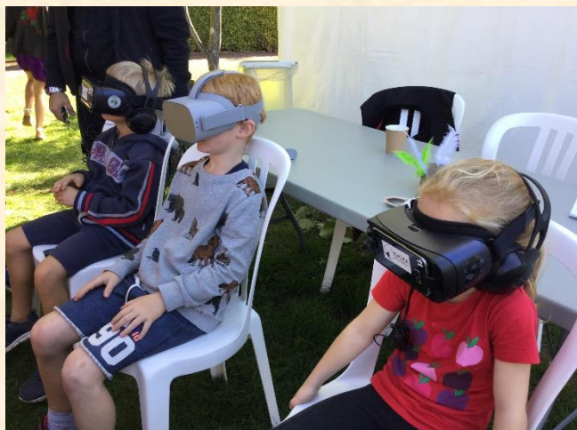
Hele verden kan ses fra Børkop

3A havde, i ugen før, besøg af en huskunstner, som sammen med klassen skabte et virkelig fint og stærkt performance-foredrag. Det var ikke muligt for eleverne at optræde live, så de bidrog i stedet med en videooptagelse, som blev vist på storskærm på biblioteket. Man kan heldigvis også se filmen på skolens facebookside 😊