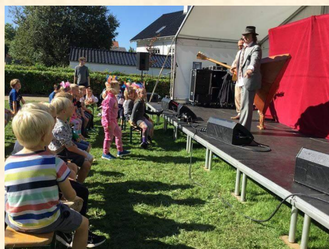
3A øver sig