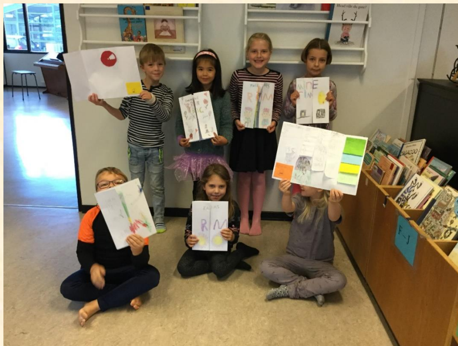
1A har til morgensamling læst højt fra deres flotte foldebøger