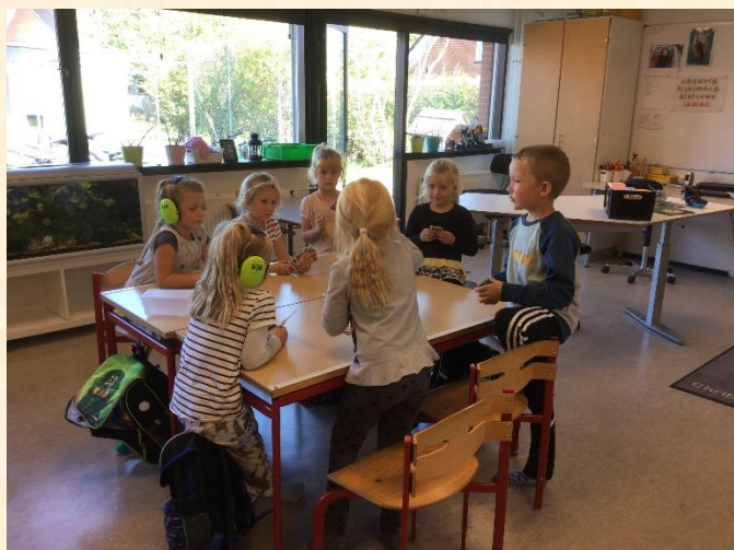
Der spilles i 0A

I indskolingen har pædagerne sat fokus på "selvkontrol", i 3A er der bl.a. arbejdet med elevernes styrker og i 2A er eleverne blevet introduceret for børne-yoga.