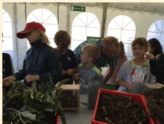
Der bygges insekthoteller.