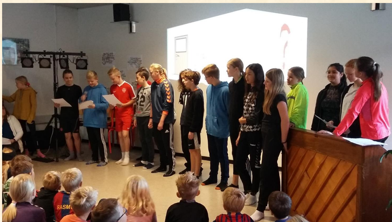
6A synger på engelsk – tre drenge gør det endda solo ☺