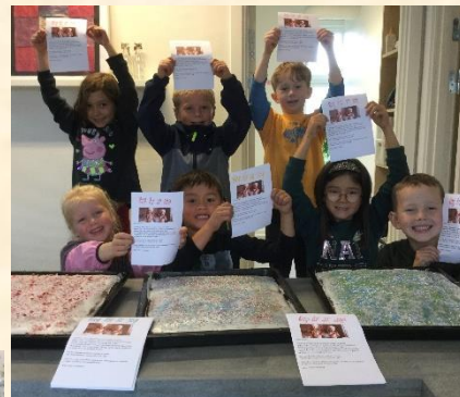
Glade børn og lækre kager i Fritidshuset.

I år kunne vi desværre ikke invitere jer på kaffe og kage. I stedet blev der bagt kage til alle børn i SFO, og så har de fået en lille opfordring med hjem om en frivillig donation til BørneTelefonen. Der var stor rift om kagen ☺