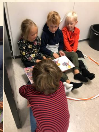
1A samarbejder i billedkunst og i dansk.