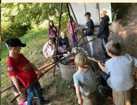
Det lykkedes – Så er der snobrød, YES!