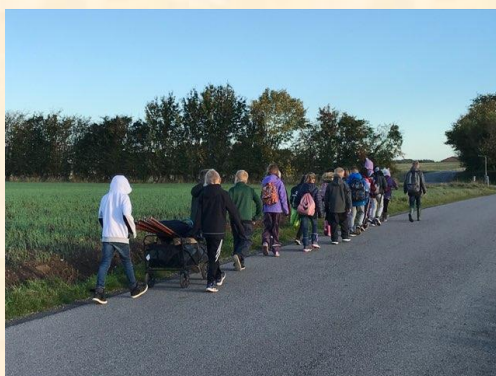
3A på vej i skoven