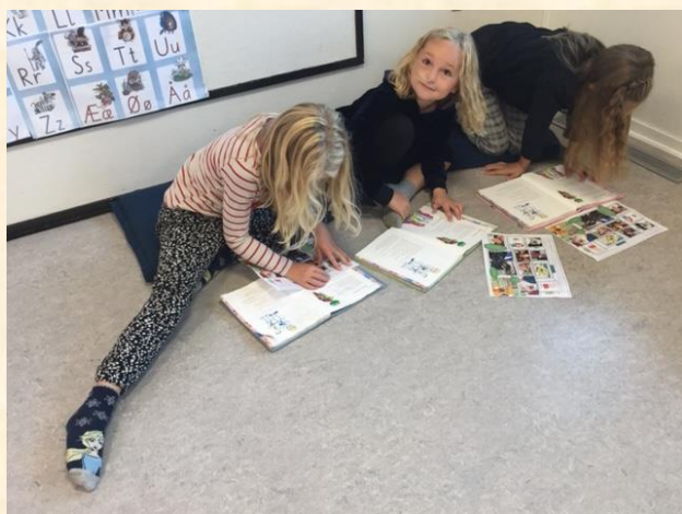
2A arbejder koncentreret både inde og ude