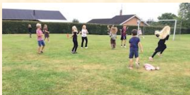
- og så er det tid til en omgang rundbold ☺