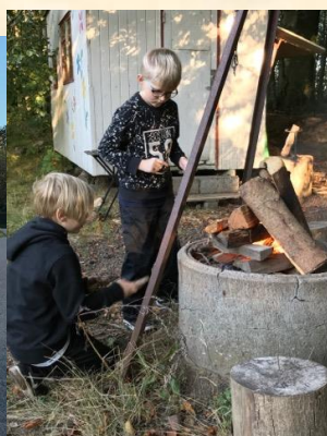
Hvordan gør vi lige???