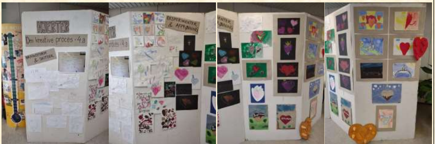
4A har arbejdet med kreative og skabende processer

Traditionen tro bidrager også skolens kunstnere til udstillingen, og i år har alle klasser været repræsenteret enten med deres "Hjertekunst" eller med plakaterne til Lions Fredsplakatkonkurrence .