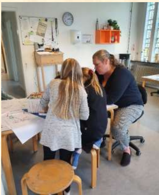
"Kom, lad os tegne"

Også i Fritidshuset er der åbnet op for, at man kan lege og hygge sig sammen på tværs af klasser. Det sætter vi alle pris på.