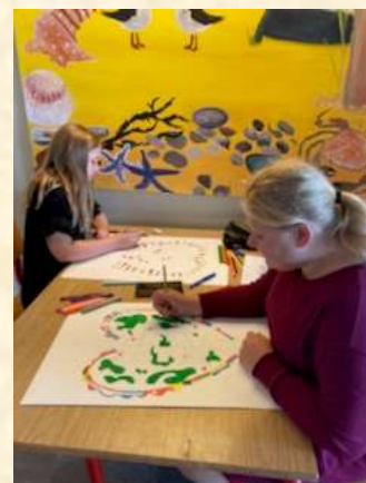
Fuld fokus alle steder