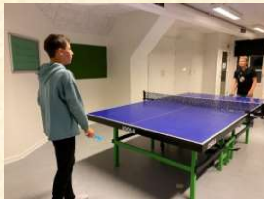
Der blev vist også spillet "nat- bordtennis"

På den anden side af efterårsferien vil der være nogle mandage, hvor der er mulighed for at komme i sløjde, det gælder både for SFO1 og SFO2.