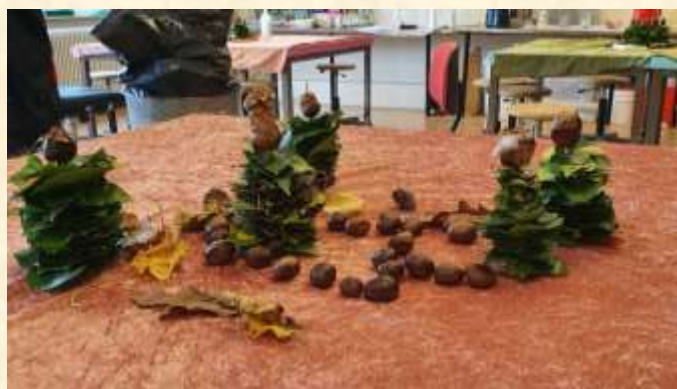
1A har lavet smuk efterårs bordpynt

Tusind tak for et fantastisk fremmøde, den gode stemning I bidrager med og alle donationerne – vi glæder os allerede til næste år, hvor vi nok bliver nødt til at bage endnu mere, så ingen går sultne eller tomhændede hjem ☺