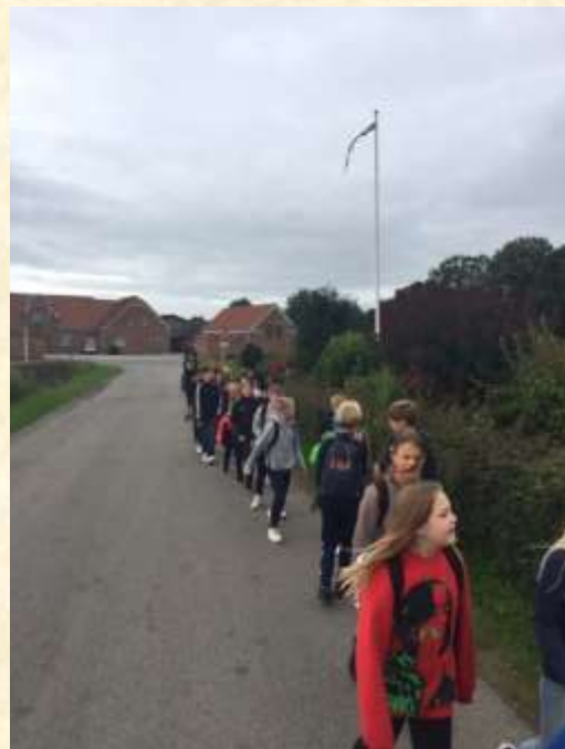
I samlet flok går det afsted