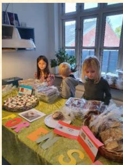
Knækbrød og cookies blev hurtigt udsolgt