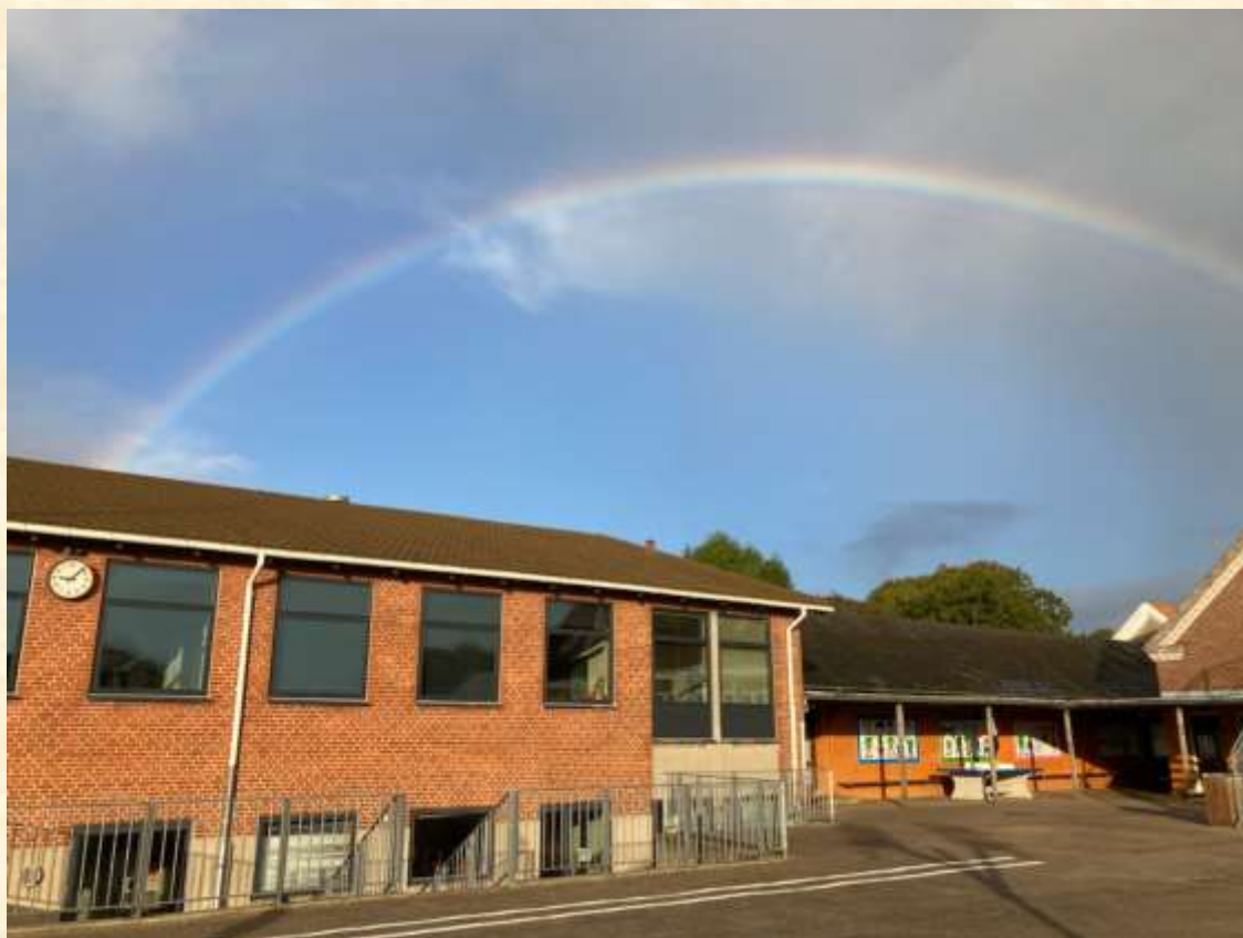
Der er guld for enden af regnbuen – en skole fuld af skønne børn og dygtige medarbejdere ☺

Det har været en stor fornøjelse at være med ved klassernes velbesøgte forældremøde og opleve den gode stemning og det konstruktive samarbejde. Det er glædeligt, at så mange forældre har meldt sig til at være en del af klasseforældreråd og hurtigt har igangsat arrangementer til glæde for børn og forældre.