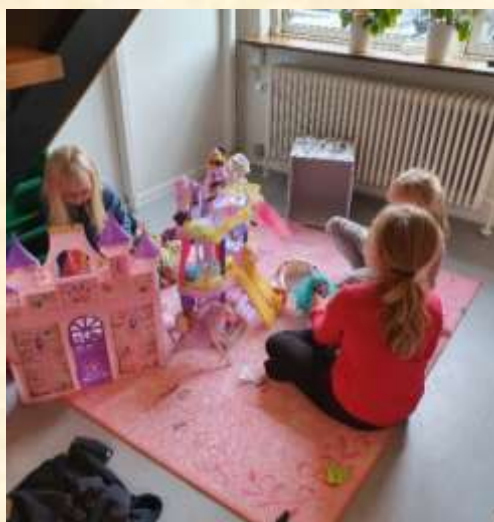
Der er masser af legekroge i huset.