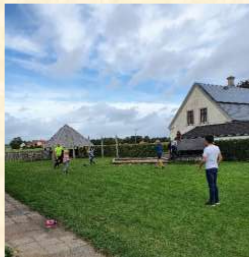
Små og store spiller stikbold