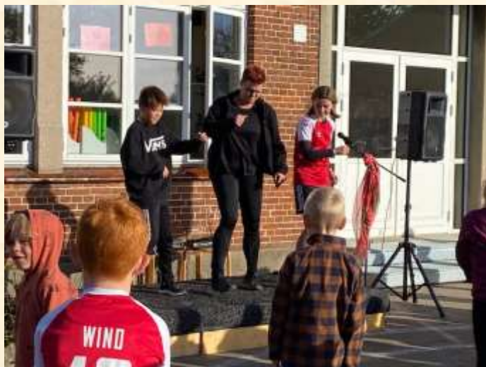
Der danses og varmes godt op til årets motionsløb