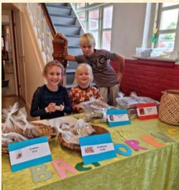
Kom bare – vi er klar til salget ☺