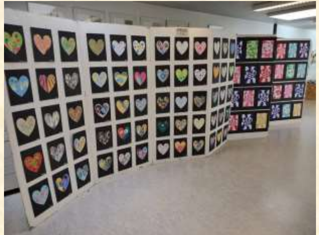
Smukke indskolings-hjerter i mange afskygninger